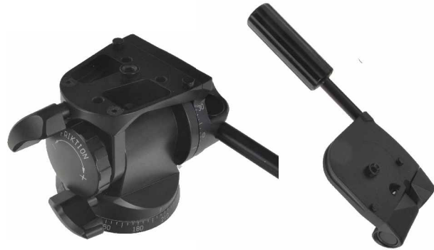
Grundkörper Basic unit