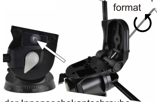
Bauteil für Hochformat Component for portrait format

Mit Hilfe der Innensechskantschraube M6x16 wird das Bauteil für Hochformat auf dem Grundkörper befestigt. Auf diesem wird dann die jeweilige Schnellkupplungsbasis aufgesetzt und mit der Innensechskantschraube M6x10 verschraubt. The component for portrait format is fastened to the basic unit using hex socket cap screw M6x16. The quick-release coupling base is attached to the component and screwed tight with the hex socket cap screw M6x10.