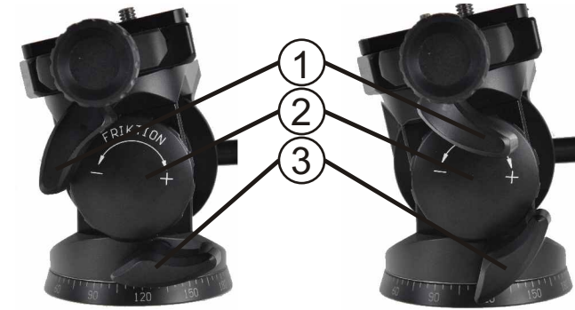
blockierte Stellung engaged position