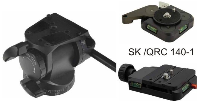
Grundkörper Basic unit