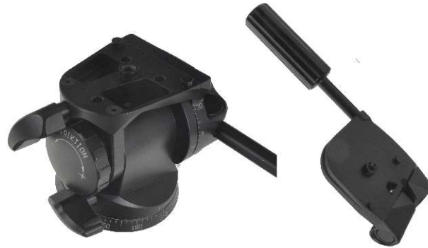
Grundkörper Basic unit