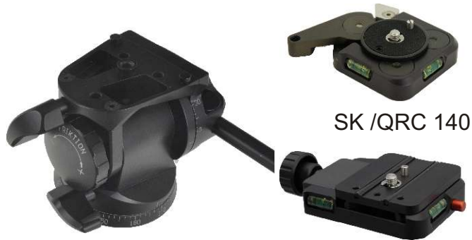
Grundkörper Basic unit