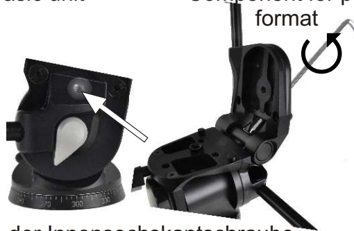
Bauteil für Hochformat Component for portrait format

Mit Hilfe der Innensechskantschraube M6x16 wird das Bauteil für Hochformat auf dem Grundkörper befestigt. Auf diesem wird dann die jeweilige Schnellkupplungsbasis aufgesetzt und mit der Innensechskantschraube M6x10 verschraubt. The component for portrait format is fastened to the basic unit using hex socket cap screw M6x16. The quick-release coupling base is attached to the component and screwed tight with the hex socket cap screw M6x10.