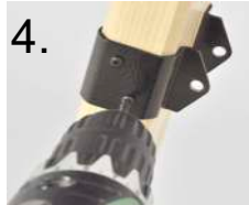
4. 2 Schrauben lösen unscrew 2 screws