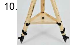
10. Platte aufsetzen und festschrauben mount deposit tray

Bei Stativen ohne Ablageplatte sind zusätzlich noch ein Satz Einhängschellen erforderlich (bitte zusätzlich bestellen (Art. Nr. 310022 für Stative UNI, 310020 für Stative REPORT)).