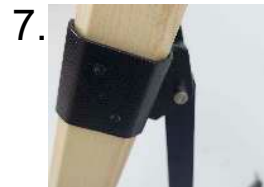
7. Spreizsicherung einhängen connect spread stopper