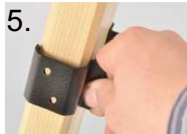
5. Einhängblech entfernen remove sheet metal