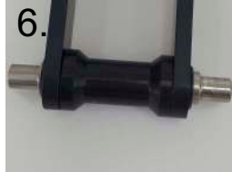
6. Spreizsicherung vorbereiten prepare spread stopper