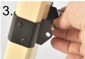
3. Bolzen entfernen remove bolt