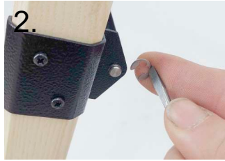
2. Sicherungsscheibe entfernen remove circlip