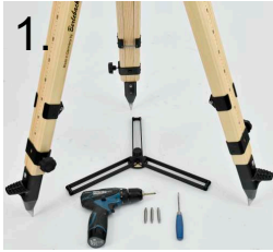
1. Schraubendreher PZ1 Screwdriver PZ1