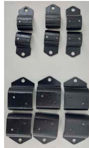
Einhängschellen für Stative Report Tripod leg brackets Report #310020

By tripods without deposit tray you need also one kit tripod leg brackets (please order separately (item no.310022 for Uni tripods, 310020 für Report tripods ))