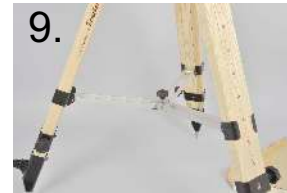
9. An jedem Bein wiederholen repeat on every leg