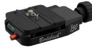
Schnellkupplung 150 • Größe: 105 x 60 x 18 mm • Gewicht: 137 g Art.nr. 320265