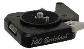
Schnellkupplung 140 • Größe: 60 x 65 x 11 mm • Gewicht: 140 g Art.nr. 320295