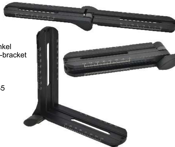
Klappwinkel folding L-bracket